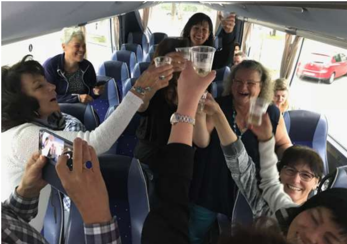
Unsere Prosecco-Delegation... (mit Paparazzi Pat)

Wenn man vom Bahnhof Arbon neben der schnaubenden Dampflok in Richtung Ausstellungsareal schlenderte, einem knapp über dem Kopf gemächlich die Junkers Ju-52, besser bekannt als "Tante Ju" drüber flog und auf der Strasse nebenan diverse Oldtimerautos und Motorräder aus den Anfängen der Motorfahrzeuggeschichte vorbeifuhren, lief einem Gänsehaut über den Rücken. Dann ein Blick auf den Bodensee wo das mächtige Dampfschiff und mehrere Dampfboote ihre Rauchschwaden zogen, ja, die Arbon Classic's sind alleweil ein Besuch wert!