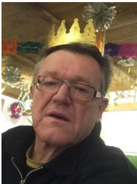
So sieht ein König aus, der nichts zu Essen bekommen hat...