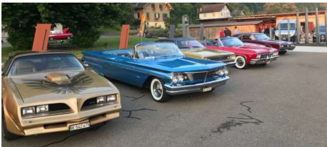
Sorgten in positivem Sinne für Aufsehen...